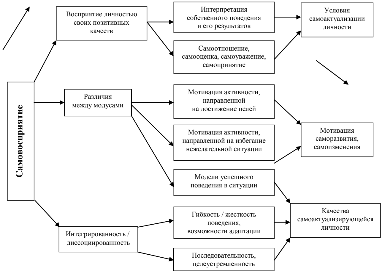
Рис. 2. Влияние самовосприятия на самоактуализацию личности