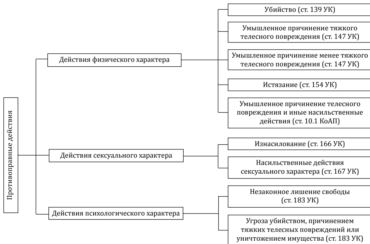
Рис. 2. Группы противоправных действий в сфере домашнего насилия в Республике Беларусь

Основываясь на международной практике, О. Г. Каразей выделяет группы противоправных действий в сфере домашнего насилия физического, сексуального, психологического, экономического характера [5, с. 49]. В белорусском законодательстве присутствуют только три группы противоправных действий в сфере домашнего насилия, которые представлены на рисунке-схеме (рис. 2).