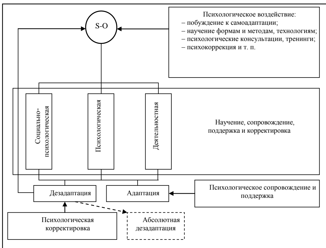
Рис. 1. Модель организации ПСА молодежи к условиям деятельности в органах внутренних дел и обучению в вузе

Еще раз акцентируем внимание на том, что наряду с общностью важнейших проявлений для подавляющего большинства молодежи психосоциальная адаптация имеет глубоко индивидуальные черты, что объективно определяется различиями в умственном развитии и воспитании, свойствах личности и характера, жизненном опыте и убеждениях, интересах и стремлениях.