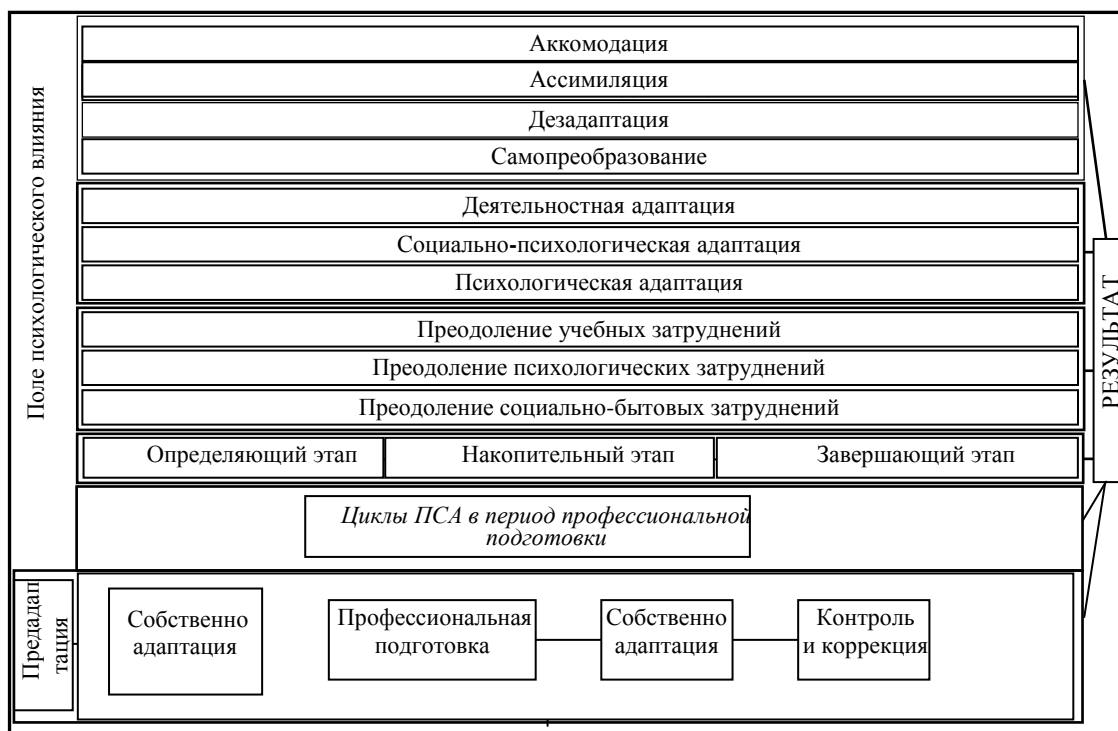
Рис. 2. Системная модель организации ПСА к условиям деятельности в структуре органов внутренних дел

Априори прямо вытекает роль и значимость профессорско-преподавательского состава для всей жизни и деятельности вуза. Тем не менее педагог (наставник) может оказывать на личность не только позитивное, но и негативное влияние. Таким образом, на передний план выдвигается проблема подбора, расстановки и переподготовки педагогического состава вузов, наставников в системе органов внутренних дел, причем в основе последней должно лежать усвоение новейших концепций и технологий психолого-педагогического воздействия на курсантов и слушателей, молодых специалистов.