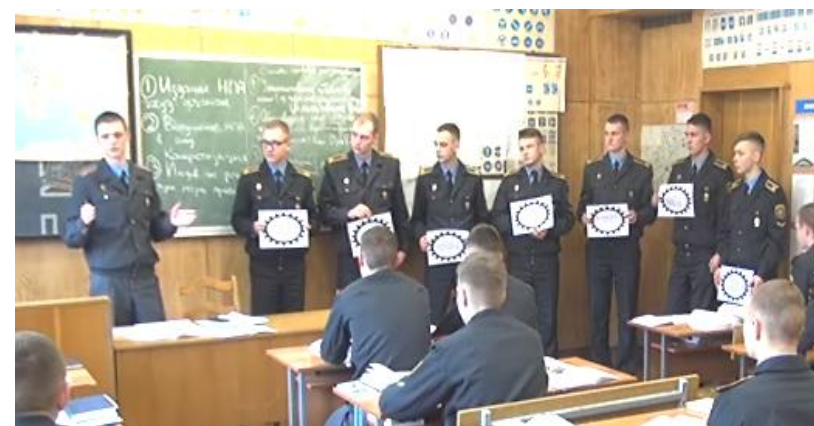
Рис. 2. Реализация предложенного метода в ходе семинарского занятия

после построения действующего механизма правового регулирования на примере некоторых нормативных правовых актов была проиллюстрирована теоретико-правовая категория «эффективность правового регулирования», продемонстрированы пути ее повышения через воздействие на отдельные элементы механизма правового регулирования.