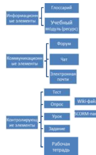
Рис. 1. Типы и структура учебных элементов

группе, курсанту; предоставление информации другим подсистемам. Функции модуля «Факультет» отличаются от функций модуля «Учебное управление» сферами ответственности и сбора данных. Функции модуля «Кафедра»: публикация информационных и учебных материалов, контролируемых учебных элементов; обеспечение доступа к учебным материалам; оценка результатов самостоятельной работы курсантов; сбор и обработка статистической информации по отдельной кафедре, учебной группе, курсанту, преподавателю, учебной дисциплине факультета; доступ к текущей учебной и отчетной информации по кафедре, учебной группе, курсанту, преподавателю, учебной дисциплине факультета; предоставление информации другим подсистемам. Типы и структуры учебных модулей представлена на рис. 1.