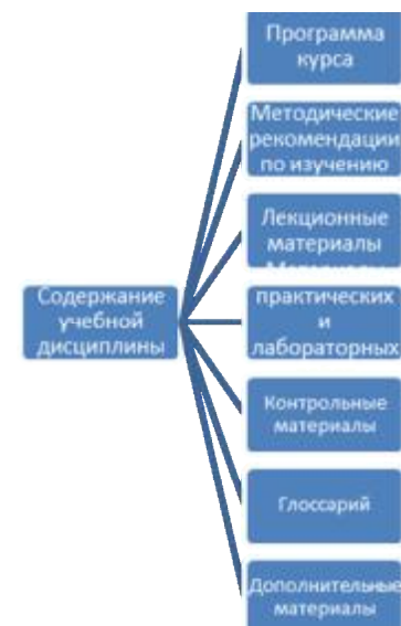
Рис. 3. Содержание учебной дисциплины

Полноценный информационно-образовательный портал помимо основного содержания (учебных модулей), как правило, включает в себя набор сопутствующих информационных разделов, необходимых для полноценного изучения определенной предметной области. К числу основных следует отнести такие учебные модули, как «Новости», «Персоналии», «История», «Библиотека», «Ссылки», «Конференции», «Нормативная правовая поддержка», «Глоссарий» и др.